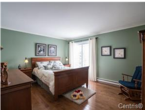
Chambre à coucher principale